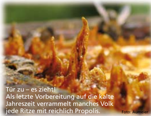
Tür zu – es zieht! Als letzte Vorbereitung auf die kalte Jahreszeit verrammelt manches Volk jede Ritze mit reichlich Propolis.